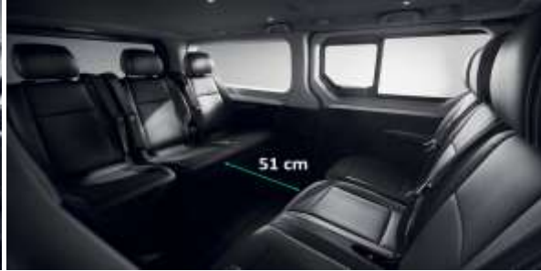
Adaptabilitate: bancheta cu 3 locuri de pe randul 2 poate fi repositionata astfel incat pasagerii sa poarte conversatii fara sa depuna prea mult efort