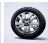
Avens 17" Aliaj RDIF03