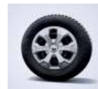
Capac ornamental 16"