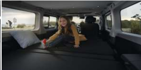
Ai avut o saptamana grea in care Spaceclass ti-a servit drept birou, sala de sedinte sau locul unde ai servit masa in tihna? Weekend-ul este aici si familia doreste sa evadeze din mediul urban? Cu pachetul Escapade transformi Spaceclass-ul din birou in rulota si evadezi din cotidian.