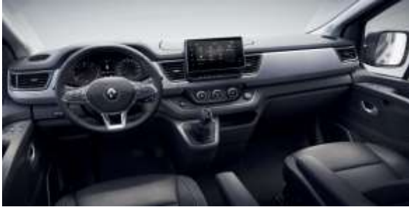
Design bord unic Spaceclass