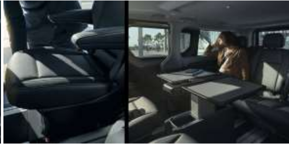
Business trip? Ai tot ce iti trebuie pentru a iti desfasura activitatea pe parcursul calatoriei: priza pentru laptop, mufa USB pentru incarcarea telefonului mobil, sala de sedinte, scaune confortabile si o capacitate de pana la 5 locuri pe randurile 2 si 3