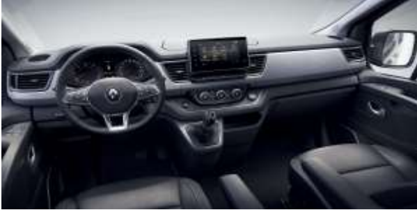
Design bord unic Spaceclass