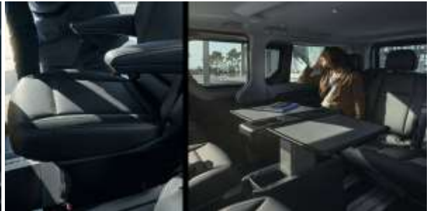
Business trip? Ai tot ce iti trebuie pentru a iti desfasura activitatea pe parcursul calatoriei: priza pentru laptop, mufa USB pentru incarcarea telefonului mobil, sala de sedinte, scaune confortabile si o capacitate de pana la 5 locuri pe randurile 2 si 3