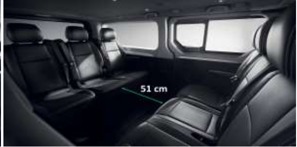
Adaptabilitate: bancheta cu 3 locuri de pe randul 2 poate fi repositionata astfel incat pasagerii sa poarte conversatii fara sa depuna prea mult efort.