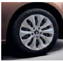
Jante otel 16", design Florida