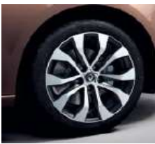
Jante aliaj 17" design Allium