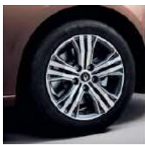
Jante aliaj 16", design diamantat Impulse