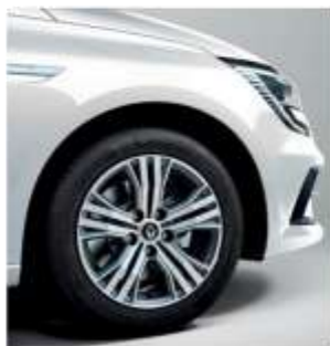
Jante aliaj 16", design diamantat Impulsa

Disponibil standard pentru motorizarea Blue dCi 115 EDC