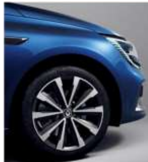
Jante aliaj 17" design diamantat Montlhéry