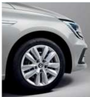
Jante de oțel 16" Flexwheel, design Elliptic