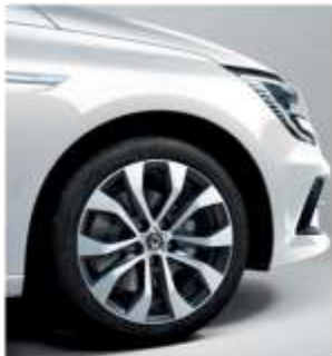
Jante aliaj 17" design ALLIUM