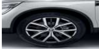
Jante de aliaj de 19" design Biton