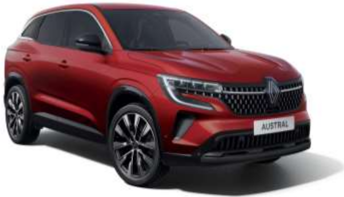
rouge flamme | rouge flamme + noir etoile