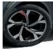
Jante aliaj 18", design RS Line (RALU18/RDIF13)