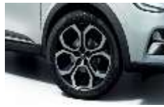
Jante aliaj 18", design Pasadena