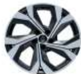
Jante aliaj 18" (RALU18/RDIF12)