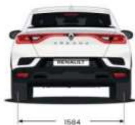
Dimensione in (mm).