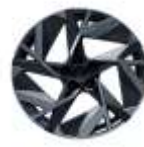
Jante aliaj 19", design esprit alpine (RALU19/RDIF11)