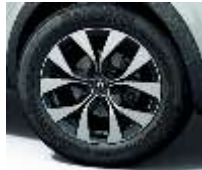
Jante aliaj 17", design Bahamas (RALU17/RDIF08)