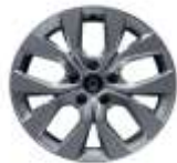
Jante aliaj 17" (RALU17/RDIF15)