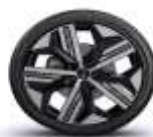
jante aliaj 20" enos