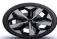
jante aliaj 20" soren