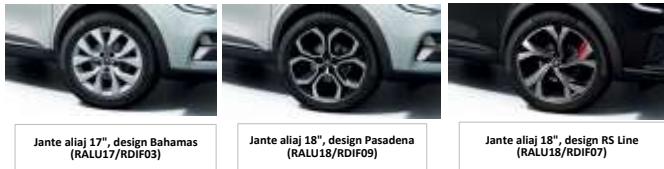
Jante aliaj 17", design Bahamas (RALU17/RDIF03)