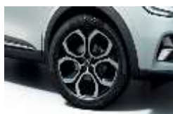
Jante aliaj 18", design Pasadena