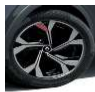
Jante aliaj 18", design RS Line (RALU18/RDIF13)