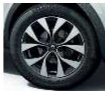
Jante aliaj 17", design Bahamas (RALU17/RDIF08)