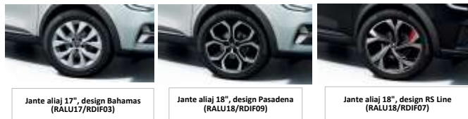
Jante aliaj 17", design Bahamas (RALU17/RDIF03)