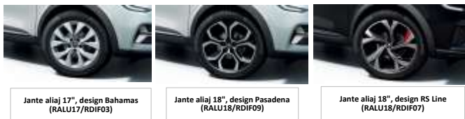
Jante aliaj 17", design Bahamas (RALU17/RDIF03)